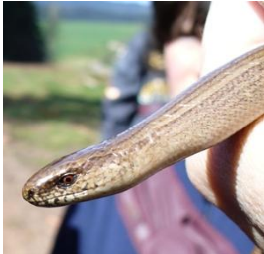
„Úlovek“ p.uč. Jitky Zelezné

První stupeň měl program ve třídách, čištění lesa a recyklaci starého papíru.