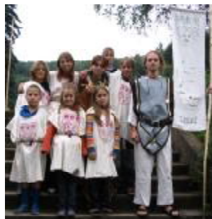
Družina pánů z Meziměstí

2. Královna tu vládne a nemá (není) to snadné A hubatými dvořany... Kuchtíci se snaží, vaří pečou smaží, raduje se poddaní!