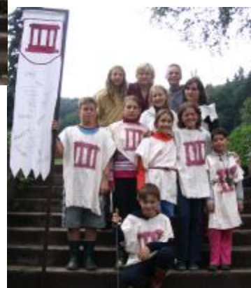
páni z Hronova