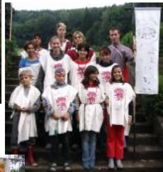
Družina pánů ze Stárkova