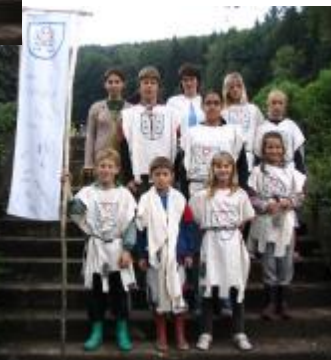
páni z Broumova