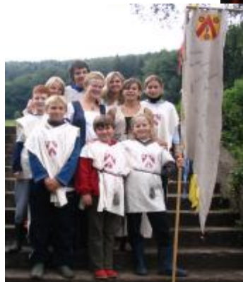
Družina pánů z Police